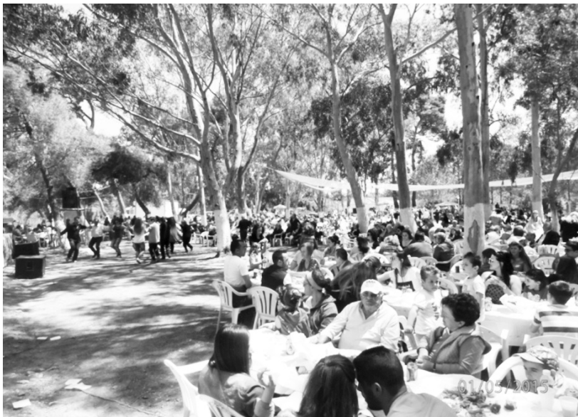
Άποψη της εκδήλωσης

Μεγάλη επιτυχία σημείωσε η εκδήλωση της Πρωτομαγιάς στο χώρο του Καϊάφα (πριν το νησάκι της Αγίας Αικατερίνης). Παρευρέθηκε πλήθος κόσμου από την ευρύτερη περιοχή του Δήμου Ζαχάρω.