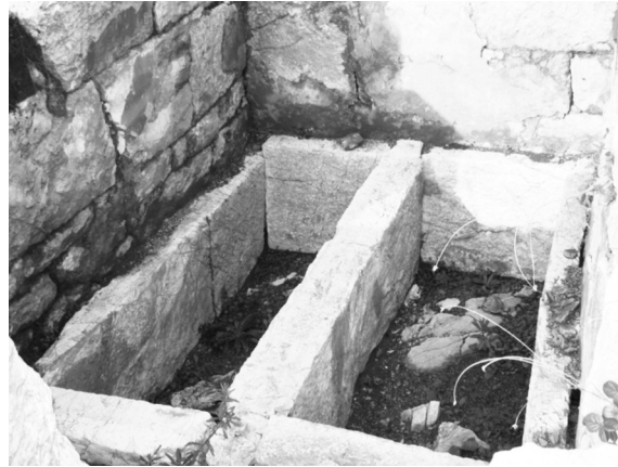
Εικ. 1. Διπλός αρχαίος τάφος στο Παλαιοχώρι Χρυσοχωρίου, στη θέση "Ξίδη". Ανασκαφή 2006.

Στον οικισμό Παλαιοχώρι του Χρυσοχωρίου, στα νότια ριζά της αρχαίας Ακροπόλεως («Κάστρο»), ανάντι και σε μικρή απόσταση από τον δρόμο Χρυσοχωρίου - Μακίστου, υπάρχουν δύο αρχαίοι διπλοί τάφοι. Ο πρώτος