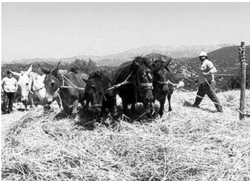
Το αλώνι και το αλώνισμα την εποχή εκείνη με τα άλογα

Δουλεύοντας με το σκεπάρνι, την πλάνη και το αρνάρι, η σανίδα γινότανε ένα γερό και στέριο φυτάρι.