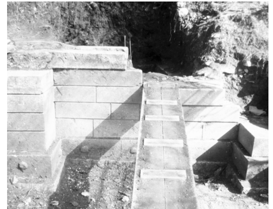
Εικ. 2. Τάφος στη θέση "Τουράκι" στο Παλαιοχώρι Χρυσοχωρίου. Ανασκαφή 2009. Φωτογραφία Θεόδωρος Α. Κατσάμπουλας, 2009.

γραμμής εκ δυσμών προς ανατολάς που πιθανόν υποδηλοί ότι οι τάφοι αυτοί, ίσως και άλλοι που δεν έχουν ανευρεθεί ακόμη, ευρίσκοντο κατά μήκος μιας κυρίας οδού που οδηγούσε στην επίσημη είσοδο του Κάστρου, την «Πύλη». Είναι γνωστό άλλωστε ότι στην αρχαιότητα οι τά-