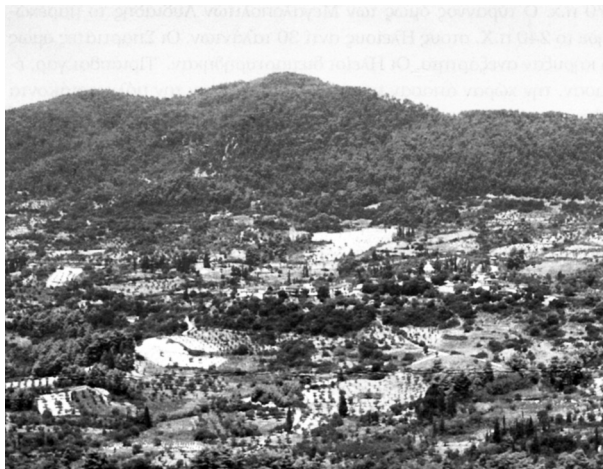
Το χωριό Μάκιστος (το χτεσινό Μπαράκου)